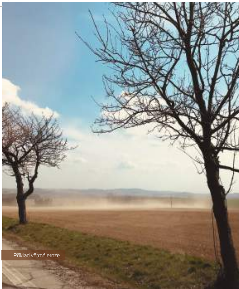
Příklad větrné eroze