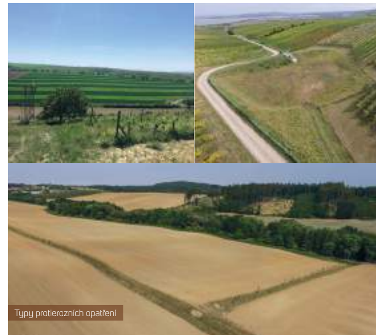
Typy protierozních opatření