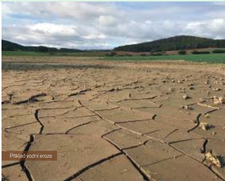
Příklad vodní eroze